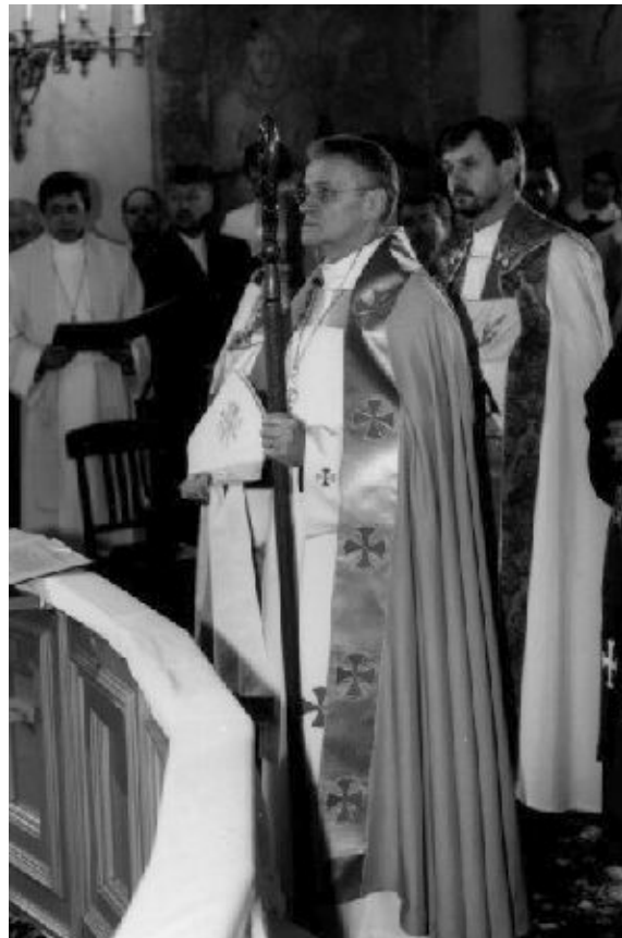
Vastpühitsetud peapiiskop Andres Pöder Tallinna Toomkiriku altari ees 2.vebruaril 2005