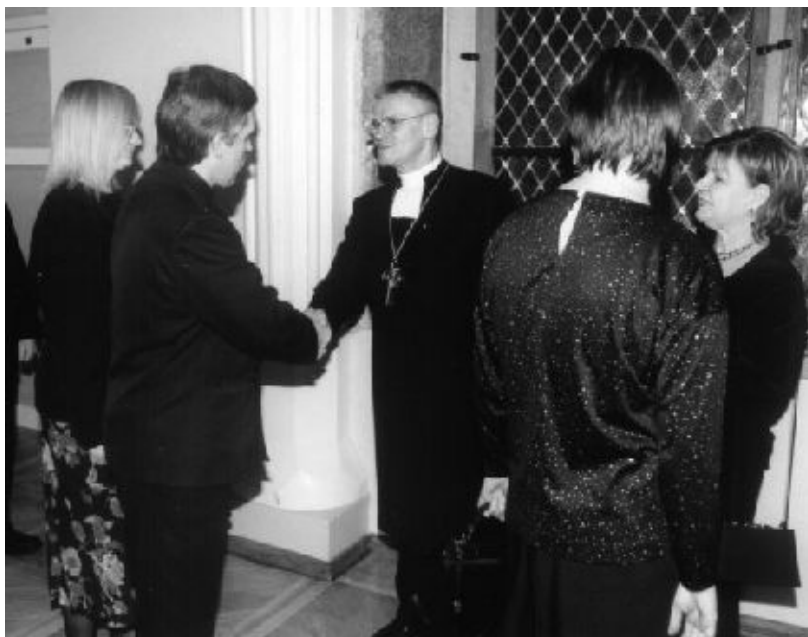
Koguduse õpetaja õnnitlemas oma koolivennast peapiiskoppi pühitsemisjärgsel vastuvõtul Mustpeade Majas