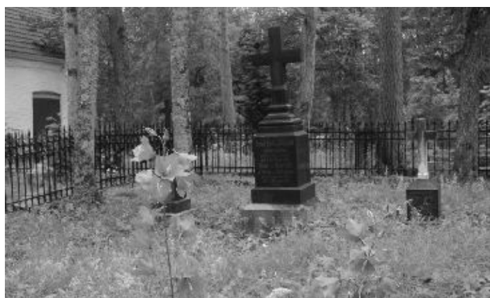
Alu mõisniku Lilienfeldi pere hauaplats kabeli kõrval