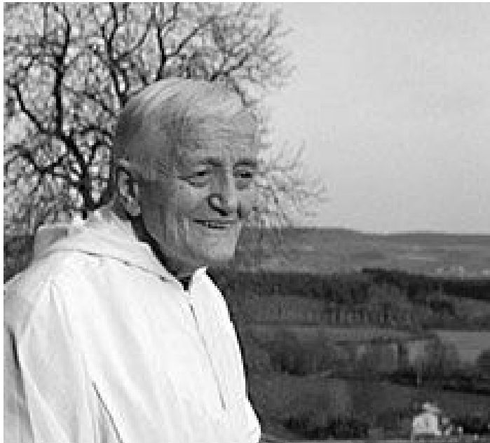
Taizé vennaskonna rajaja vend Roger 12.mai 1915 – 16.august 2005

1940.aasta augustis läks 25-aastane vend Roger oma sünnimaalt Šveitsist ema kodumaale, okupeeritud Prantsusmaale väikesesse Taizé külla, et luua selles maailmas koht, kus valitseks usaldus ja leppimine inimeste vahel. Tänapäevaks on seal kogukonnas alaliselt elamas üle saja erineva kristliku taustaga venna kahekümne viiest eri rahvusest. Peaaegu kogu aasta jooksul koguneb noori inimesi kõikidelt mandritelt Taizésse nädalastele kohtumistele. Väga populaarsed on aastavahetuse kokkutulekud, mida korraldatakse Euroopa erinevates suurlinnades. 1986 vennaskonda külastanud paavst Johannes Paulus II ütles, et Taizés käimine on nagu allikale minel.