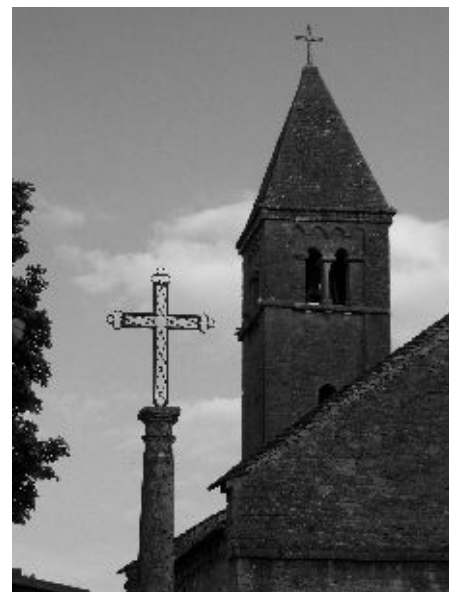
Taizé külakirik – koht vaikuseks

Nädal Taizés on jaotatud üpriski sarnaste tegevustega päevadeks. Hommik algab palvusega ning jätkub piiblitunniga. Neid arutlusi juhivad vennad ning pärast ametlikku tundi jätkub vestlus väikestes gruppides. Minu grupp koosnes peamiselt poolakatest, sakslastest ja rumeenlastest. Piibligrupp jäi nädala jooksul samaks, ainult teemad muutusid. Veidi pärast keskpäeva algab