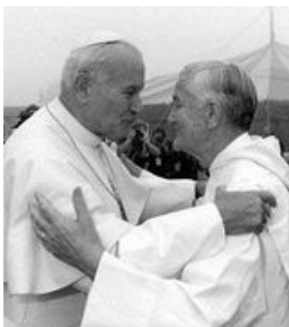
Paavst Johannes Paulus II ja vend Roger - tänavu igavikku lahkunud kaks suurmeest

16. augusti õhtusel palvusel tappis keegi vaimuhaige naine mitme tuhande inimese silme all Taizé kloostri rajaja, 90-aastase vend Roger'. See sündmus oli väga traagiline ning sööbis jäädavalt kõikide sealolijate mällu. Ometi aitasid vennad oma tugevuse ja palvetega kogu laagril armastuses koos püsida ning lahkunud venna