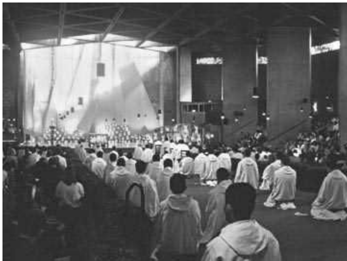
Palvusi kloostri kirikus peetakse kolm korda päevas, keskel põlvitamas Taizé vennad

Kappelskäri sadamas Rootsisis. Sealts edasi viis tee Taani ja Saksamaa suunas, kus nägin esimest korda suuri tuulegeneraatoreid põldudel kõrgumas. Peaaegu igas Saksamaa külas on kirik ja teravate katustega majad seisavad kobaras koos. Hamburgi kaudu jõudsin Volksdorfi, kus mind hämmastas õhtune Taizé palvus, mida ma varem polnud kogenud. Inimesed istusid maas kümnetest küünaldest ümbritsetuna. Hirm oli midagi valesi teha.