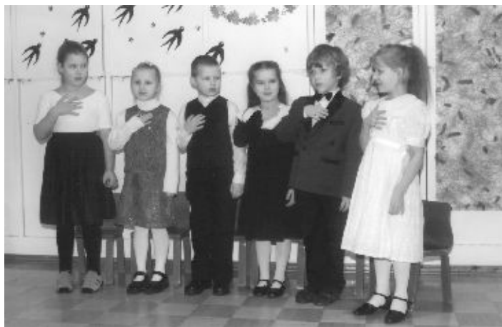
Rapla erilasteaed Pääsupesa vanema rühma lapsed oma lasteaias 20. aastapäeval esitamas laulu inglitest