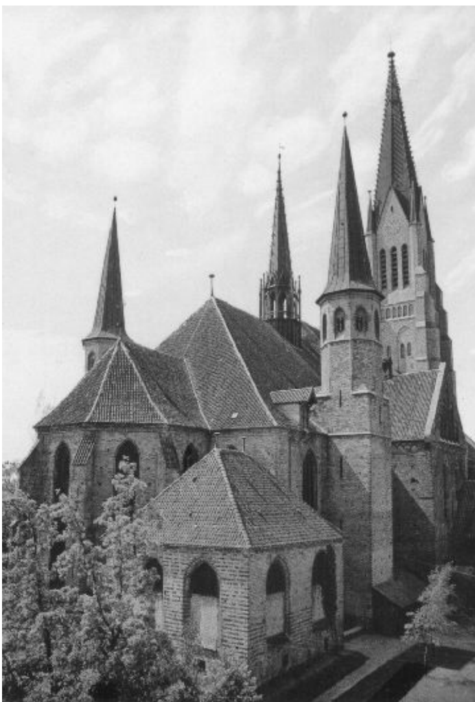
Keskaegne Schleswigi toomkirik mõjub eriti suursuguselt

Kõrval asuva Johanniitide kloostri aias eksponeeritakse piiblist tuntud taimi, mida suures osas meilgi kasvatatakse maitse- või ravimtaimedena. Loodavas skulptuuride aias näeb kunstnike suuremõtmelisi plokkidest väljatahtud taieseid prohvetite teemal. Sügava mulje jätab võimas Schleswigi Toomkirik oma piiblistseenidest kokkupandud erakordselt peene puidutöölusega altariseinaga.