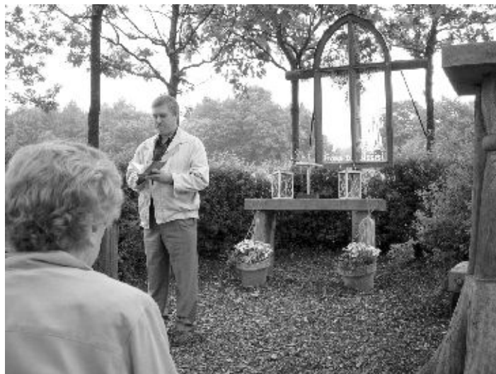
Palvus „kasvavas“ kirikus, altarivitraažil kujutatud Assisi Franciscus

Schleswig-Holsteini liidumaa pealinnas Kielis saime pisut osa algavast Kieli-nädalast, kuhu just oli saabumas ka pastori perest pärit praegune Saksamaa kantsler Angela Merkel. Kuna põhilise aja viibisime Saksamaa suurlinnadest kaugemal, siis jalgpalli