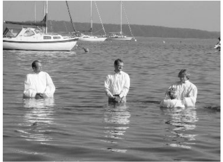
Borby koguduse leerilaste ristimine Läänemeres

Koguduse majandamiseks ja töötajatele garantii andmiseks töökoha säilimise suhtes on moodustatud Borby koguduse toetamise ühing, kuhu kuulub praeguseks umbes 200 liiget. Vastavalt võimalusele teeb inimene pangale püsikorralduse, makstes iga kuu määratud päevaks liikmemaksuna kindla summa ühingu arvele. See on tulevikku suunatud ettevõtmine kiriku põhiväärtuste hoidmiseks. Kogudus omalt poolt pakub ühingu liikmeile ühiseid väljasõite ja meeleolukaid koosviibimisi. Jaanipäeval näiteks ollakse lõkke ääres