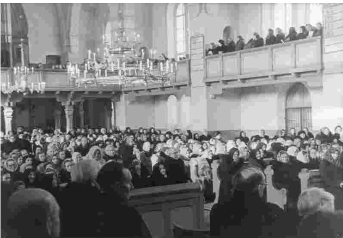
Oma õpetajaga on tulnud jumalaga jätma kirikutäis rahvast