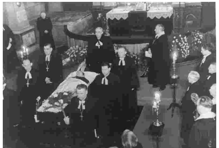
Kirstupanekutalitusel Tallinna Piiskoplikus Toomkirikus