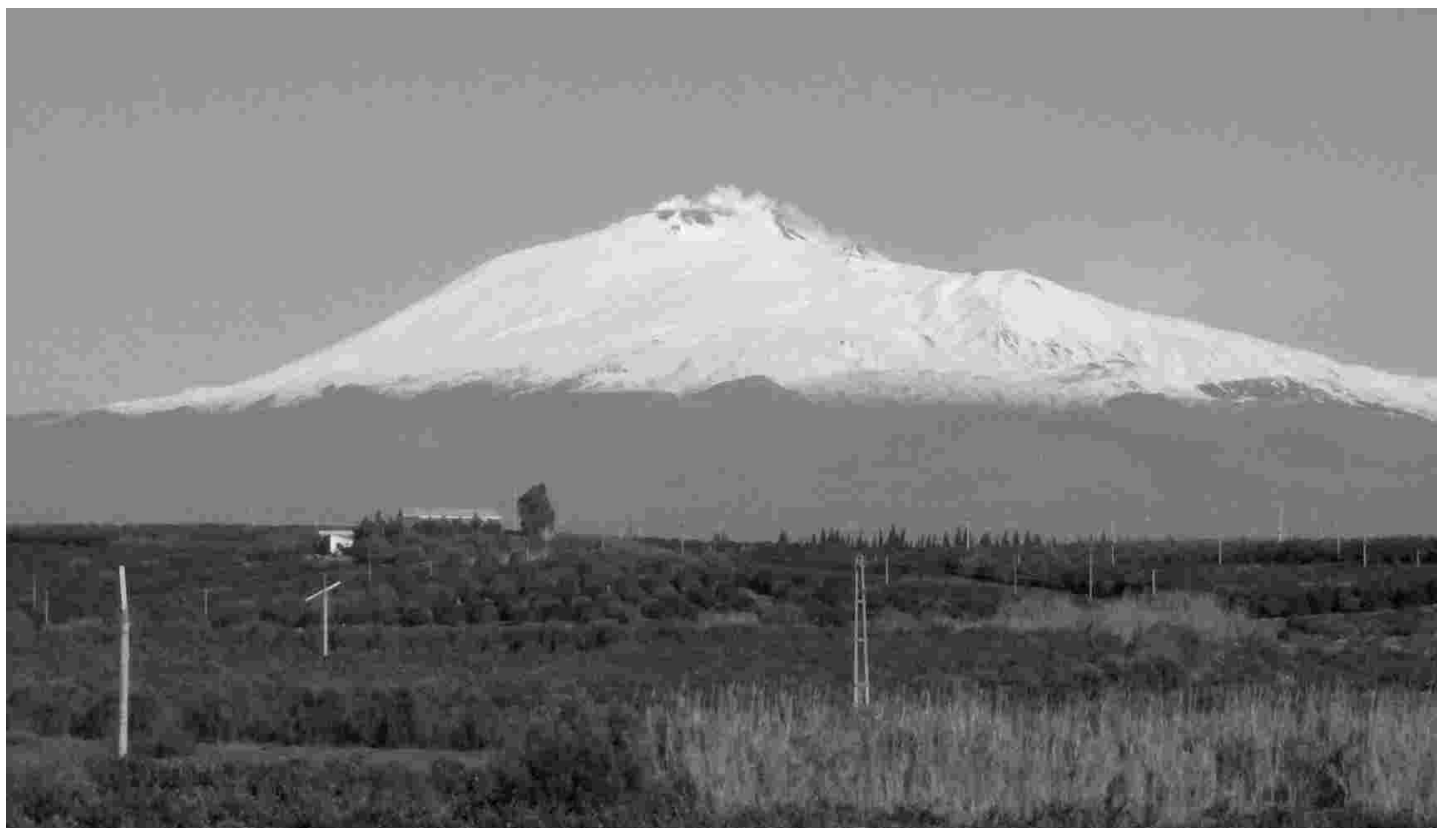
Sitsiilia saare idaranniku servas asuv 3550 m kõrgune lumise tipuga ja pidevalt suitsev Etna on Euroopa aktiivseim vulkaan