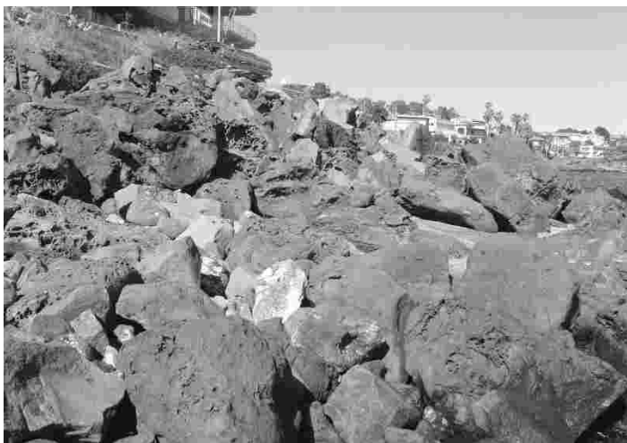
Hangunud laava tükke leidub 30 km kaugusel vulkaani kraatrist

Itaalia on katoliiklik maa ja rahvas peab oma usust kinni. Käisime kohalikus kirikus missal, mida peetakse igal õhtul kell kuus. Meid võõrustanud pereema laulab selle kiriku kaheksaliikmelises naisansambelis, kes esines ka sellel missal. Kogu teenistuse vältel olid vaimuliku kõrval istumas või seismas kuus last, kes jagasid laululehti, tegid korjandust või muid neile kohaseid toiminguid. Meile harjumatult jagati armulaualistele ainult oblaati, mitte veini. Istusime kirikus üsna ees ja pärast missat tuli vaimulik meid kätkpidi tervitama. Kirik oli nüüdisaegne ehitis, kuid sinna