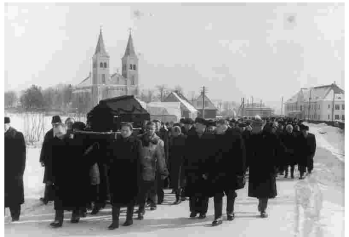
Rapla koguduse mehed kandmas puusärki kirikust kalmistule