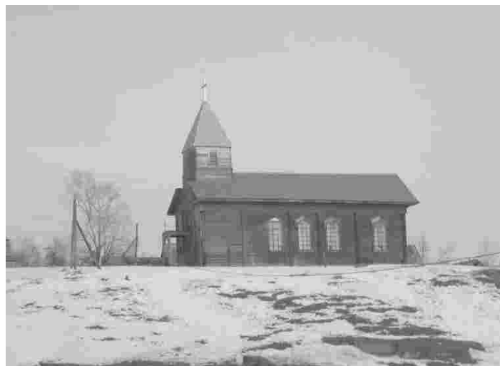
Kirik põhiliselt eestlastega asustatud Ülem-Suetuki külas Siberis