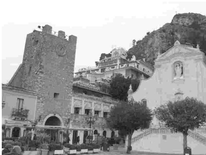
Taormina linn, paremal kohalik katoliku kirik

jõudmiseks tuli minna mäkke – veel kõrgemale, kui oli meie peatuspaik.