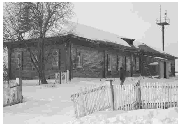
Ülem-Suetuki küla koolimaja

Telefon: 00-7-3812-325-868, mobiil: 00-7-3812-903-982-0465 Skype: omskinkeskiset