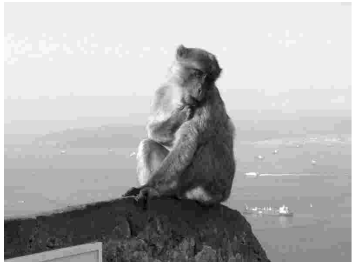
Gibraltari „valitseja“ oma troonil

Muljetavaldav on viisteist aastat tagasi Casablancasse ehitatud 25 000 inimest mahutav kuningas Hassan II mošee. See ookeani äärde ja osaliselt vee peale rajatud maailma suuruselt kolmas muhameedlaste pühamu näib erilisel rõhutatav islama vägevust. Üllatas, et ka igas bensiinijaamas on pisike mošee, kus alati on palvetajaid. Viimasest annavad tunnistust ukse taha jäetud jalanõud. Piiri- ja tollikontrolli bürokraatiale vaatamata aga peetakse Marokot üheks kõige läänelikumaks Aafrika riigiks, mille linnu ühendavad suurepärased kiirteed.