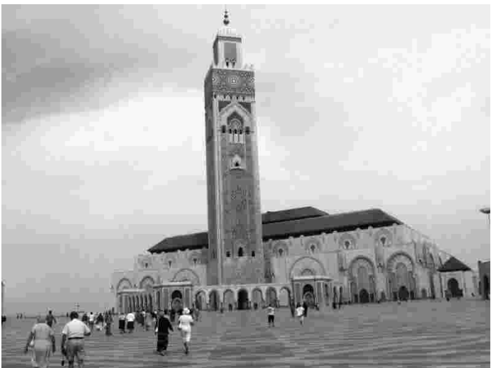
Hassan II mošee Casablancas on üks islamimaailma uhkemaid

Lisaks riigi pealinnale Rabatile külastasime Maroko kuulsaimat linna, endist pealinnat Marrakechi ning riigi äri- ja rahanduspealinnana tuntud Casablancat. Araabiamaade linnu iseloomustab müüriidat valdava vanalinn mediina . Eurooplase jaoks on kõige eksootilisem idamaade turg, mis aga peletab oma mustuse ja räpasusega. Minule jättis Marokos sügavaima elamuse sõit berberite külla Atlase eelmäestikust ning ühe sealse kodu külastamine, kus meid kostitati lõunamaaliku lahkusega.