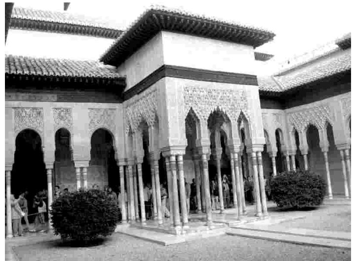
Alhambra - mauride ajastu võrratu arhitektuuripärl Granadas

Sevilla uhkus ja sümbol on maailma suurim gooti katedraal, mida Rooma Püha Peetri ja Londoni Püha Pauluse kiriku järel loetakse suuruselt kolmandaks ristiusu kirikuks maailmas. Kui seda 15. sajandi alguses endise mauride mošee kohale ehitama hakati, olevat toomhärard öelnud: „Laske meil ehitada nii suur katedraal, et igaüks, kes seda näeb, meid pöörasteks peab.“ Selles ebaharilikult laias viielöövilises kirikus on 30 kabelit ning suur apelsinipuudega siseõu. Erilist muljet avaldab 1482. aastal valminud tohutu suur kullatud pealtar. Kellatorniks on kunagise mošee juurde kuulunud minarett La Giralda , mille vaateplatvormilt avaneb kaunis vaade kogu linnale. Eripärane on see, et üles torni pääseb mööda mugavat kaldteed, mille oli rajanud valitseja, kes soovis