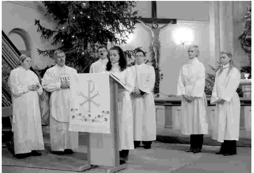
Leerilapsed kirikupalvet lugemas

Mõned aastad hiljem sain endale töökaaslaseks tõsiuskliku naise. Olen talle tänulik abi eest, sest tänu temale hakkasin uuesti piiblit lugema, kirikus käima ja iga päev palvetama. Paar aastat tagasi tasus see end küllaga.