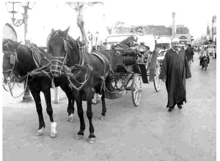
Marrakechi vanalinna tänavapilt Marokos