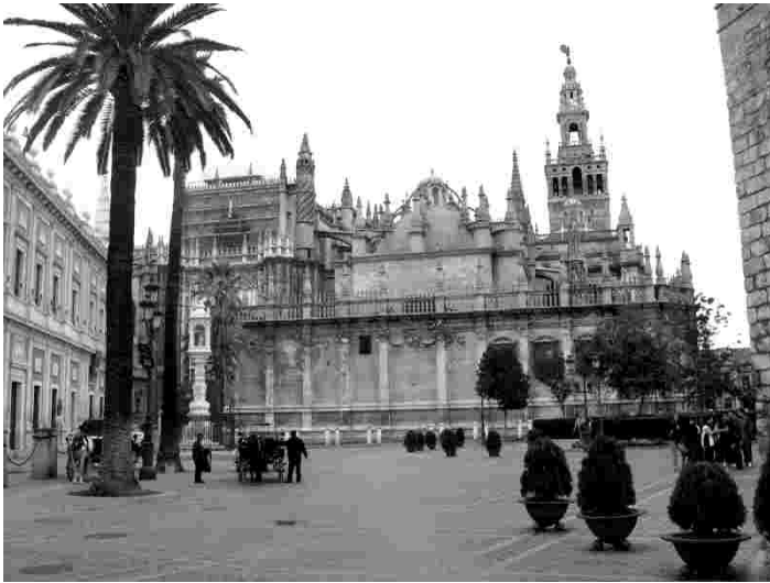
Sevilla katedraal on üks maailma suuremaid kirikuid

Peaaegu riigi keskel 660 m kõrgusel kiltmaal asuv 3 miljoni elanikuga Madrid sai Hispaania pealinnaks aastal 1561. Suursugust ja pisut eklektilist Madridi kutsutakse ehituskunsti vabaõhumuuseumiks. Kuna tegemist oli pühapäevaga, õnnestus käia mitmes kirikus, kus missasid peeti peaaegu iga tunni järel päev läbi. Madridis õnnestus oma silmaga näha ka kuulsat härjavõitlust.