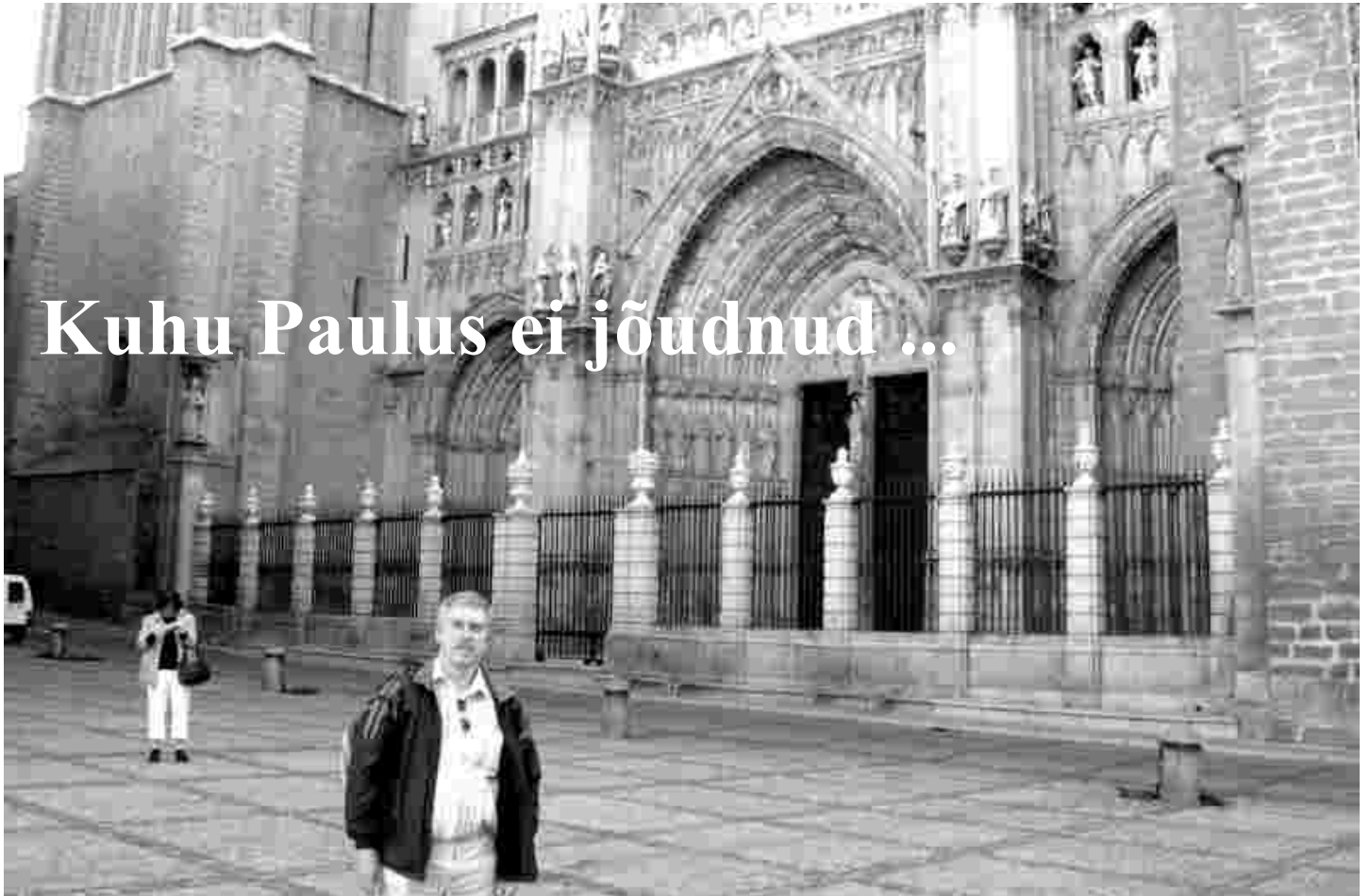
Hispaania peakiriku - Toledo katedraali ees

Kaks aastat tagasi koguduse poolt mulle juubeliks kingitud muljeterohke reisi Kreekasse ja Itaaliasse sõnastasin enda jaoks kui teekonna mööda apostlite radu. Kui mullu 25.ordinatsiooniaastapäeva puhul oli taas võimalik end pikemale reisile seada, valisin piirkonna, kuhu apostel Paulus väga minna soovis, kuid tõenäoliselt kunagi ei jõudnud. Olin 1.-22.oktoobrini palverännakul Hispaanias, Portugalis ja Marokos. Teel sai külastatud ka Suurbritanniale kuuluvat Gibraltarit ning vürstiriiki Andorrat.