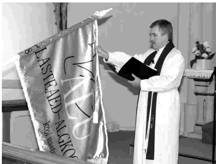
Alu lasteaed-alkkooli lipu õnnistamine

27.04. Jutlustas Rootsi Luterliku Evangeeliumi Ühenduse