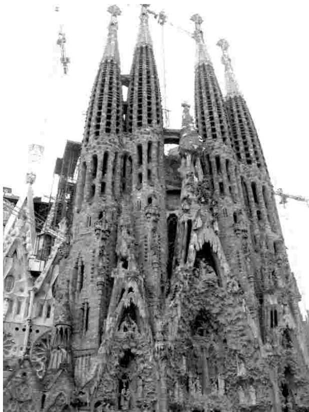
Sagrada Familia ehk Püha Perekonna kirik Barcelonas

Hispaania suuruselt teist linna Barcelonat peetakse kõige euroopalikumaks. Selle kataloonia pealinna üheks sümboliks on juba üle saja aasta ehitatud ja siiani lõpetamata Sagrada Familia ehk Püha Perekonna kirik, mis on ebaharilikumaid kirikuid maailmas. Kui arhitekt Antonio Gaudí võttis aastal 1882 pseudogooti stiilis kiriku ehitustööde juhtimise enda peale, ei jäänud algsest projektist peagi enam kivi kivi peale. Pidevalt improviseerides ning filigraanset ja aeganõudvat käsitööd ehituse juures rakendades elas ta lõpus