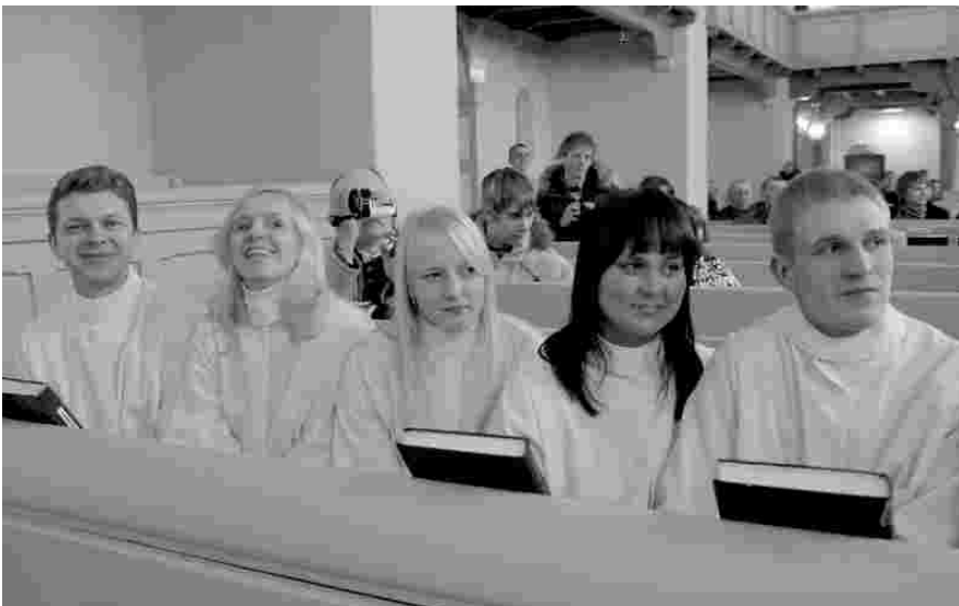
Rõõm tunda end vastuvõetuna Jumala riiki

Äkki, ühel päeval, kui mu elu raske haiguse tõttu otsekui juuksekarva otsas rippus, mõistsin, et muud väljapääsu