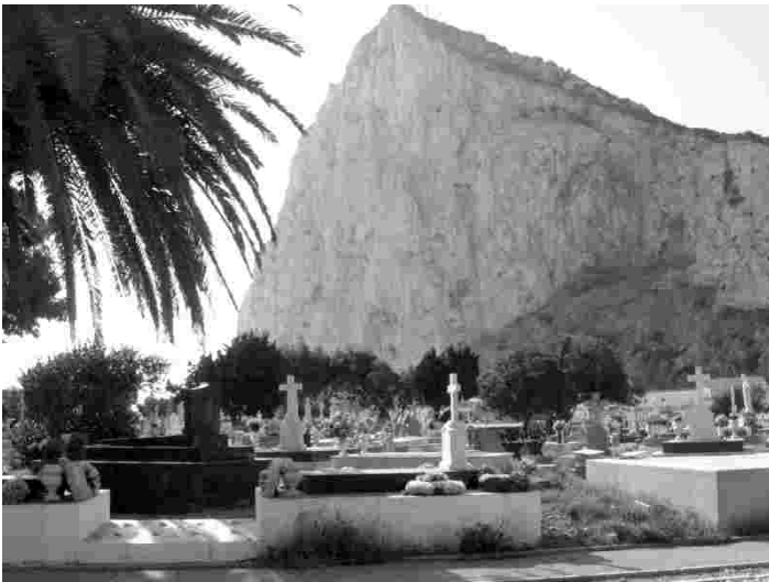
Gibraltari surnuaed asub kõrge kaljuseina all