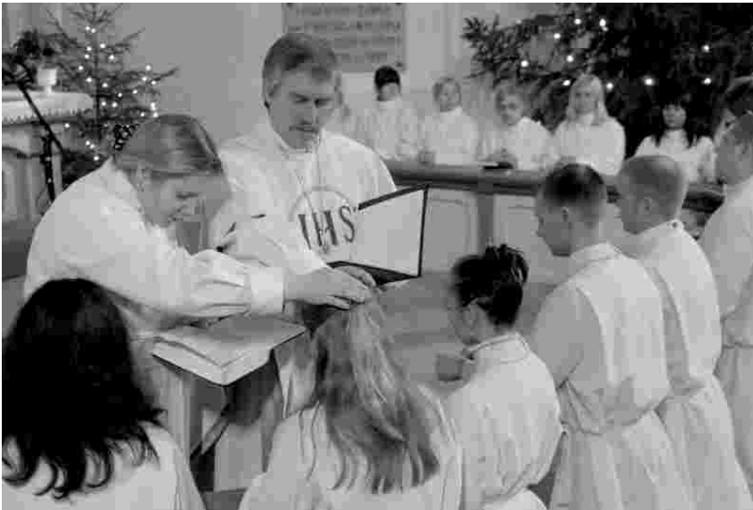
„Jumala hea Vaim olgu sinuga nüüd ja igavesti !“

Austus oma esivanemate ja selle vastu, mis neile on püha. Selle juurde jõudsin 19.septembril 2008, kui suri minu väga kallis vanaisa. Matuselauas kutsus kirikuõpetaja mind leerikooli, kuid juba enne seda olin enda jaoks selle otsuse langetanud. Leian, et ristitud ja leeritatud saades avaldan suurimat austust oma vanaemale ja meie hulgast juba lahkunud vanaisale.