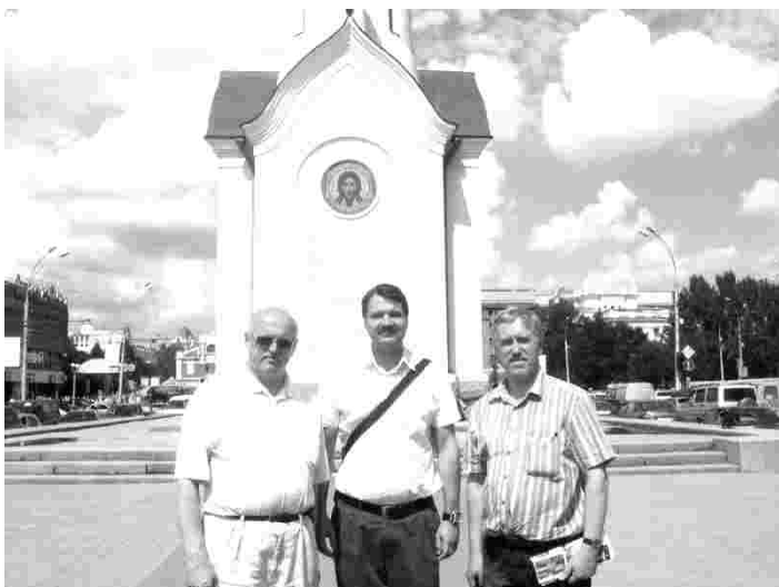
Siberi piiskop Vsevolod Lõtkiniga (keskel) Novosibirskis