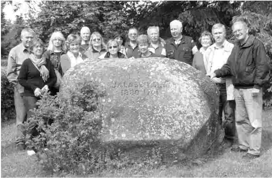
Külalised koos vastuvõtjatega Jalase kooli ees