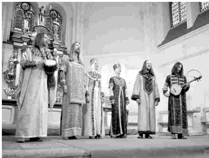
Ansambel Svetilen Venemaalt