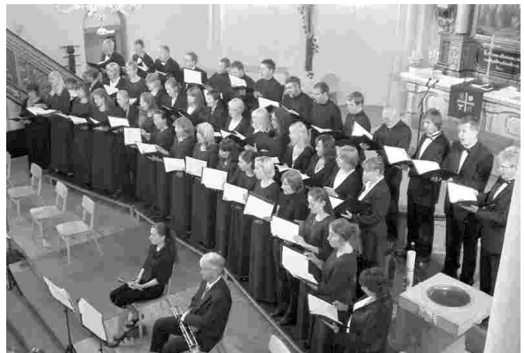
Hetk festivali lõppkontserdilt