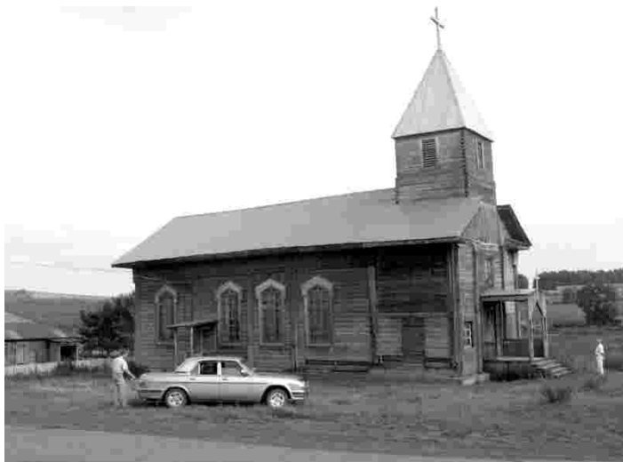
Kirik ehitati Ülem-Suetuki külla 1888

Kui 1816.aasta talurahvaseadusega pärisorjus Venemaal kaotati, tekkis talupoegadel esimene reaalne võimalus maa saamiseks. Selleks tuli aga oma kodukohast välja rännata, sest maa jäi mõisnike omandiks. Nii hakkas 19.sajandil