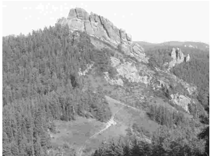
Kaunid kaljujärsakud Krasnojarski linna kohal

Et Krasnojarski kraisis elab praegu hinnanguliselt umbes 4000 eestlast, kohtusime oma rahvusaaslastega ka Ülem-Suetukile lähima linna Minussinski kogudusemajas ning pühapäeval selgus jumalateenistusel Krasnojarskis. Pea 400 aasta vanuses ja ligi miljoni elanikuga Siberi suurlinnas tegutseb väike luterlik kogudus, kuhu kuulub eri rahvustest inimesi. Koos käiakse suure korrusmaja alakorrusel asuva raamatukogu avarates