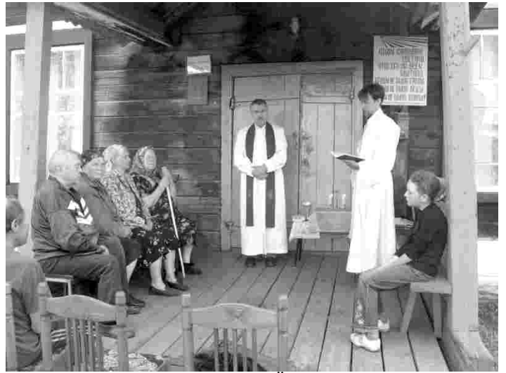
Jaanipäeva jumalateenistus Ülem-Bulanka klubi verandal