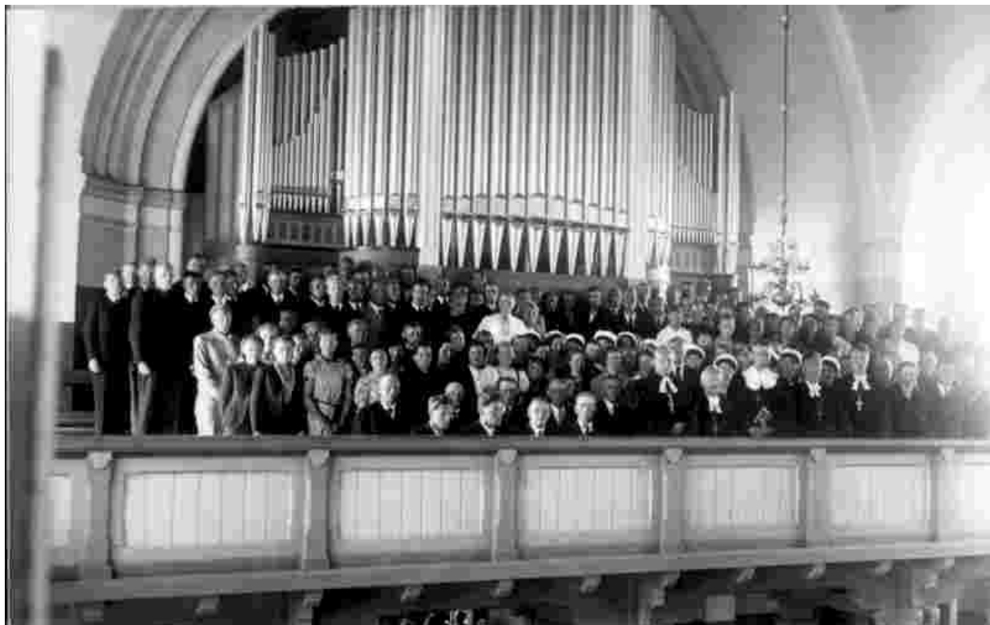
Vaimulikud ja laulukoorid Rapla kiriku uue orelit pühitsemise päeval 3.septembril 1939