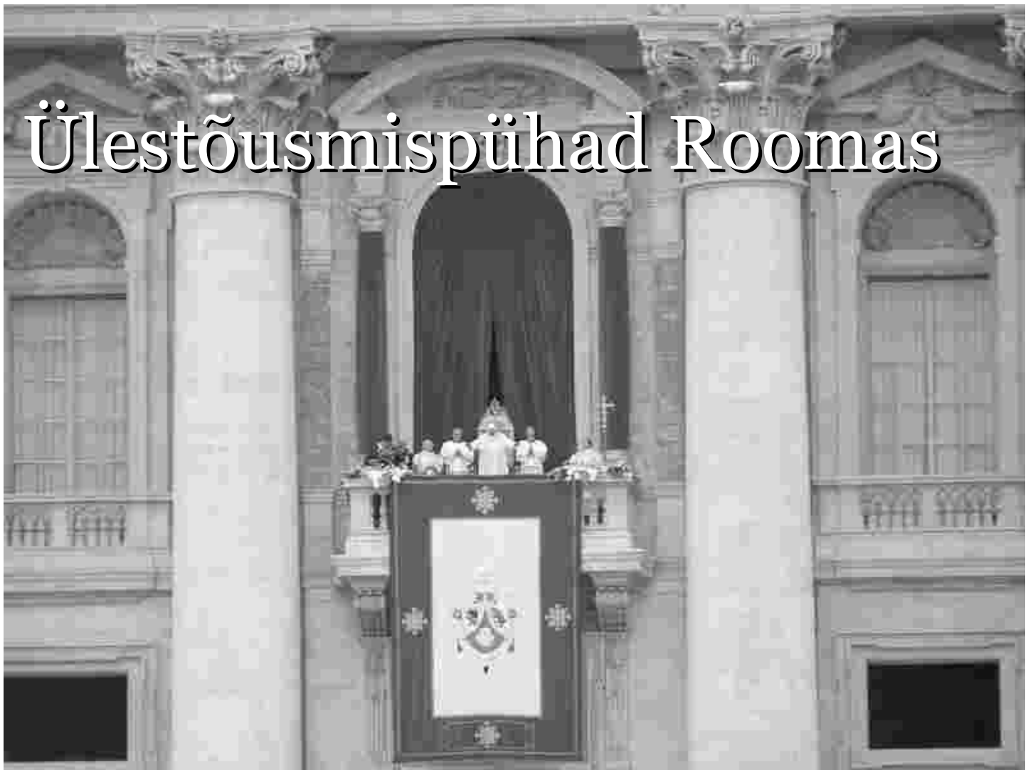
Paavst Benedictus XVI Peetri kiriku esisele platsile kogunenuid õnnistamas

Veetsime tänava ülestõusmispühad Roomas ja Vatikanis. Peamiselt sõitsime sinna sellepärast, et näha oma silmaga ja kuulda oma kõrvaga, kuidas paavst ülestõusmispüha hommikul kuulutab meie ja paljude teiste rahvaste keeles: “Kristus on üles tõusnud!”