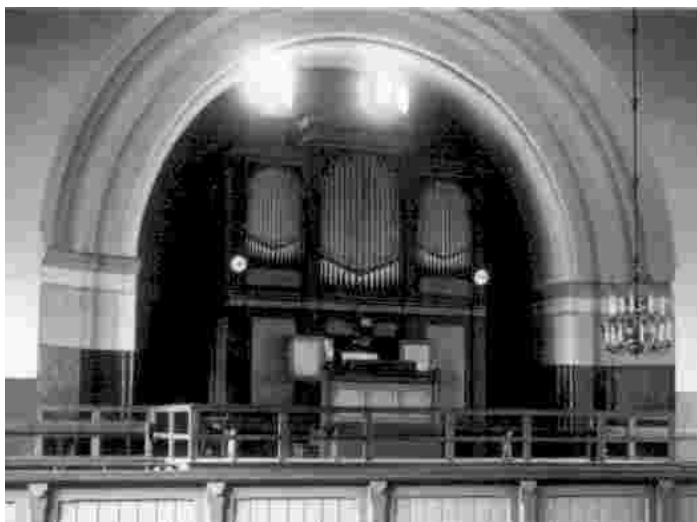
Rapla kiriku vana orel