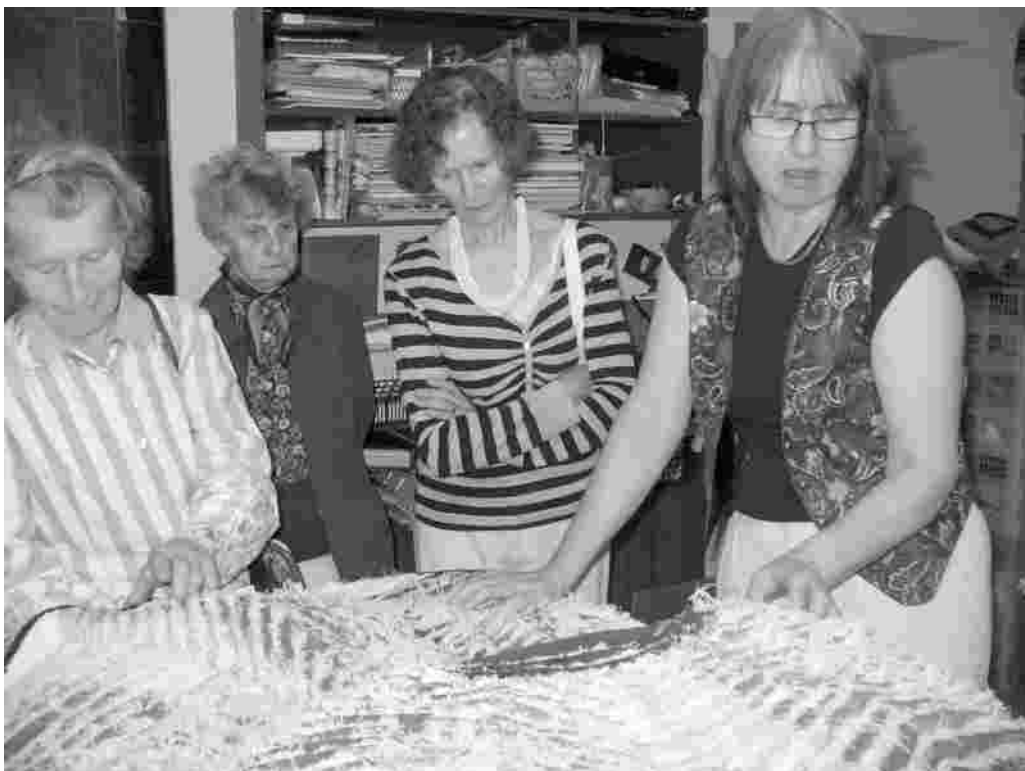
Käsitööringi naised suvel Olustveres šenilltehnikat uudistamas