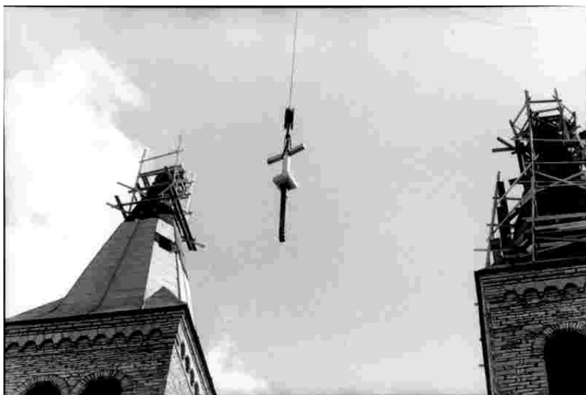
Kiriku torniristide vahetamine 2000.aastal