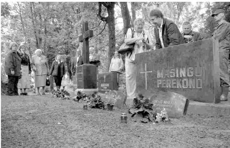
Kihelkonnapäeva traditsioonilisel kalmistu jalutuskäigul on jõutud Masingute ja Saagide platsile