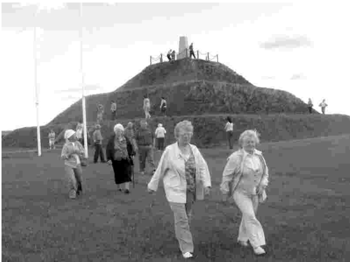
Paju lahingu mälestusmärk