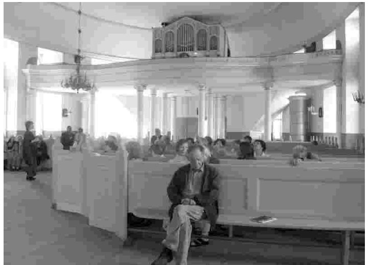
Ovaalse põhiplaani Valga Jaani kirik