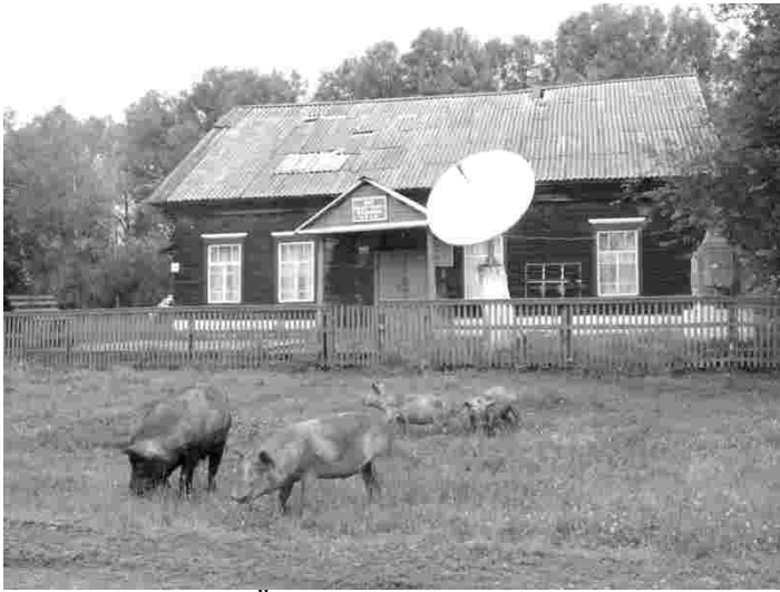
Ülem-Bulanka küla keskuseks on klubihoone

jumalateenistuse ning leeritas 66 külainimest. Alguses samal ajal veel ka klubina kasutusel olnud kirikus on jumalateenistusi peetud erineva sagedusega. Kuigi vastloodud Ülem-Suetuki kogudus liideti kodu-Eesti kirikuga, osutus regulaarne vaimulik teenimine tänu riigipiiri tekkimisele Eesti ja Venemaa vahel peaaegu võimatuks. Koguduse eest jäid hoolitsema alguses praostkonnana EELK koosseisu kuulunud, nüüdseks aga iseseisvunud Siberi luterliku kiriku vaimulikud. Praegu kuulub Ülem-Suetuki kogudus Venemaal tegutseva ingeri kiriku koosseisu, kes mõni aasta tagasi organiseeris ka kiriku torni taastamise.