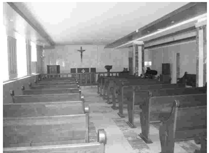
Novosibirski luterliku koguduse kirikusaal