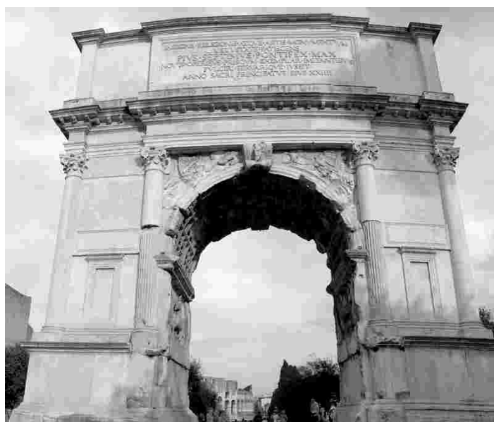
Tituse triumfikaar Rooma foorumil