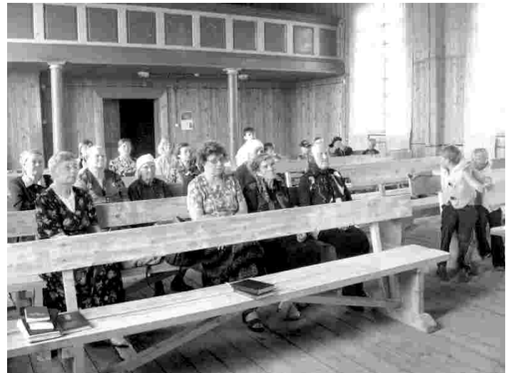
Jumalateenistusel Ülem-Suetuki kirikus