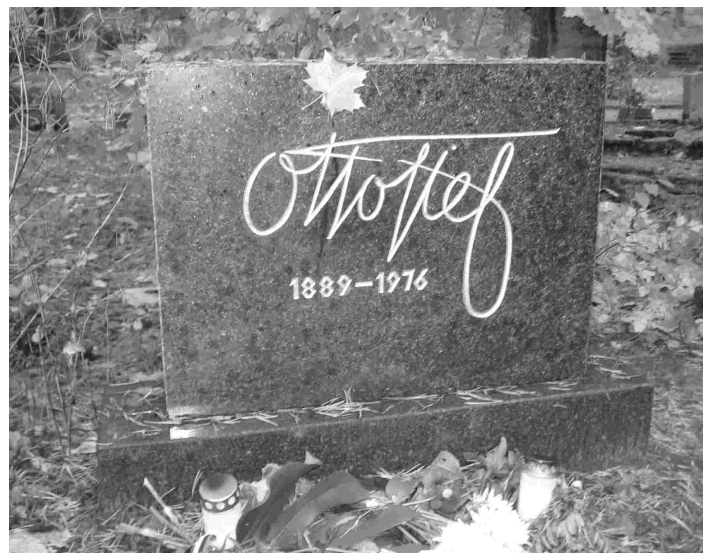
Otto Tiefi haud Tallinna Metsakalmistul