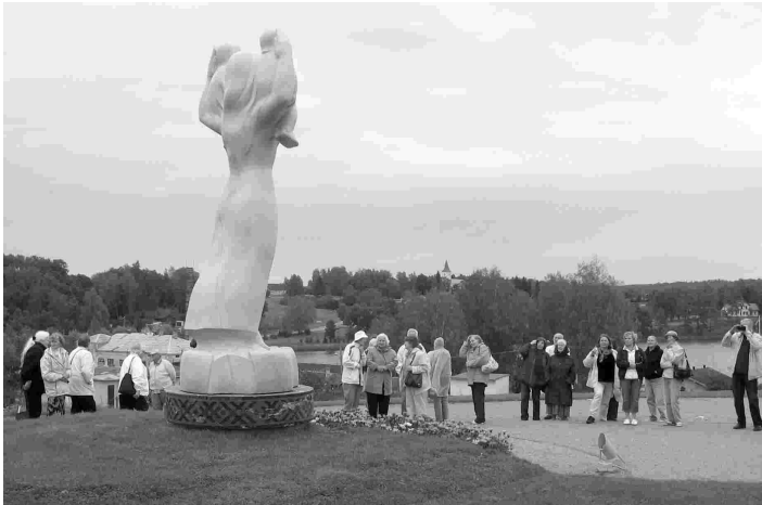
Eesti Ema kuu juures, taamal paistab Rõuge kiriku torn

Maakividest ja punastest tellistest pseudogooti stiilis Roosa Jakobi kirik on valminud aastal 1893 Rõuge abikirikuks. Kuigi 1930ndatel aastatel sai kogudus iseseisvaks, ei ole ka seal enam praegu oma vaimulikku. Et paarisaja istekohaga ilus ja korras kirik jääb keskustest eemale, kipub kahjuks ka kogudus kokku kuivama.