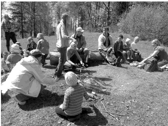
Rännakul Eestimaa kevadisse loodusesse