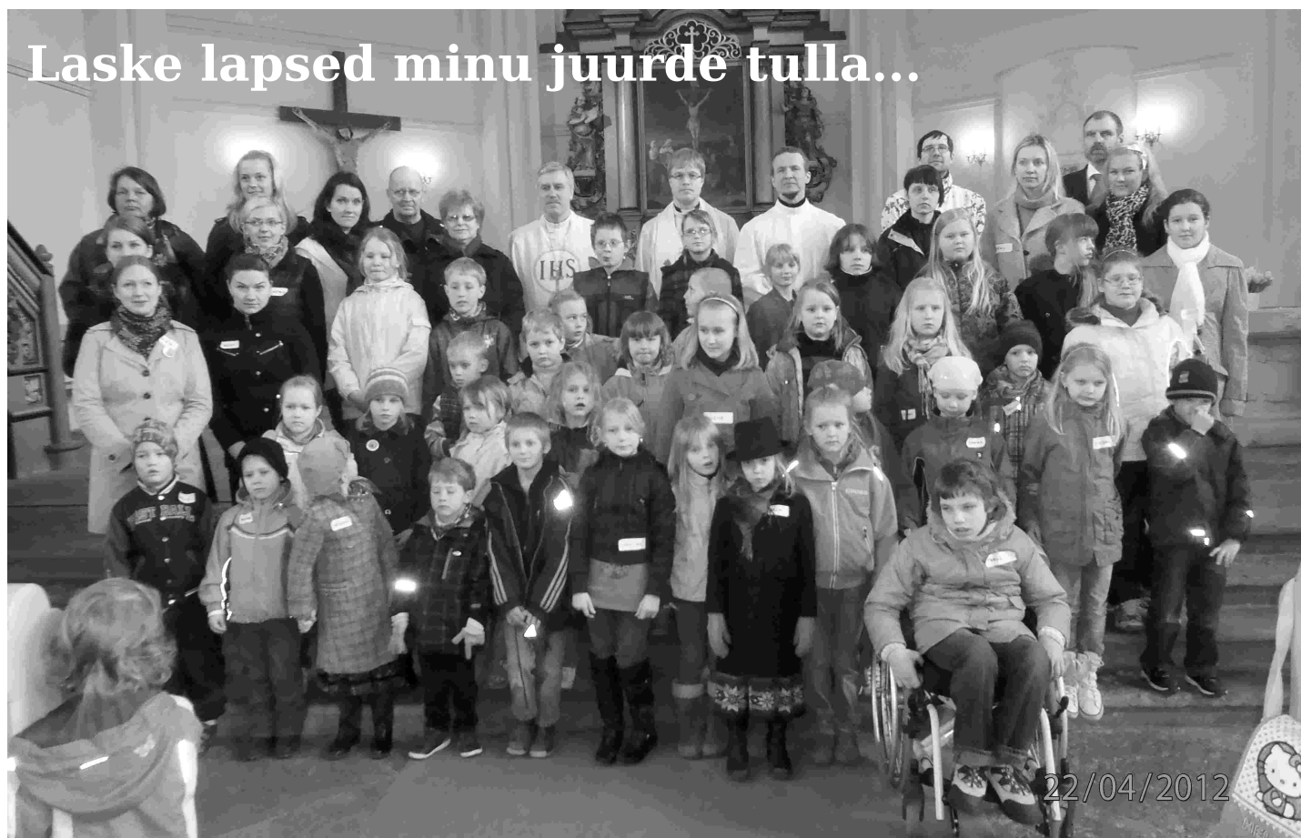
22.aprillil 2012 oli Rapla koguduses Lääne-Harju praostkonna lastepäev teemal „Hea karjane“

Rapla Maarja-Magdaleena koguduses sünnib aeg-ajalt ikka midagi eriti toredat. Pärast seitsem aastast pausi alustas 1. mail 2011 taas tegevust pühapäevakool. Niisiis on kirikus viimase pooleteise aasta jooksul olnud jälle liikvel rohkem lapsi kui varem.