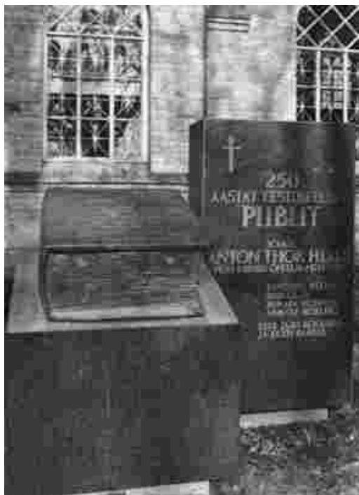
1989.aastal avati Jüri kiriku kõrval mälestusmärk 250 aastasele eestikeelsele Piiblile

et esimesed eesti keelde Piiblit tõlkinud mehed just sellistele eesmärkidele vastavat teksti kirjutada püüdsid?