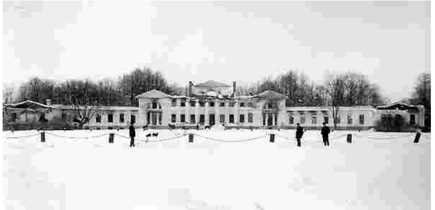
Valtu mõis 1906.aastal pärast põlengut

Edasi sõitsime läbi Kumma küla, kus majad on ehitatud ridamisi ühele poole teed. Muistsele asustuspaigale viitab küla kõrgendikul paiknev