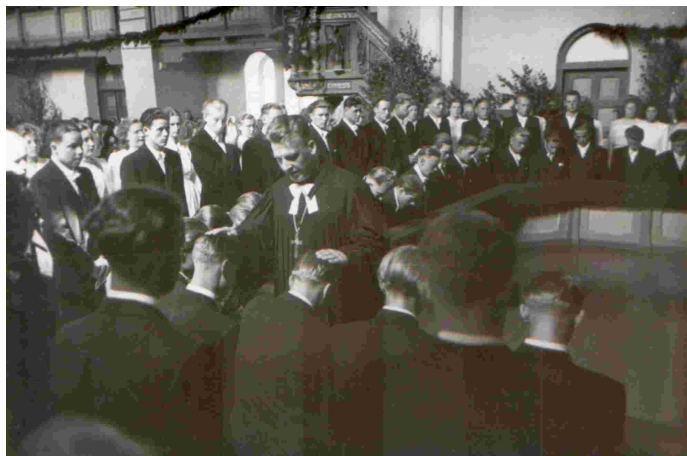
Meenutus 1950ndate teise poole suurtest leeridest Raplas

Ma olin viibinud mitmetel pühitsustel, sest tol ajal, iseseisvuse alguses peeti niisuguseid kiriklikke talitusi küll asja eest, küll ilma. Ent ma polnud kuulnud ega taibanud, et ühes lauses võib peituda nii suur, ühtaegu arusaadav kui arusaamatu vägi: „Minule antud meelevallaga pühitsen selle ristikuju Isa, Poja ja Püha Vaimu nimel!“