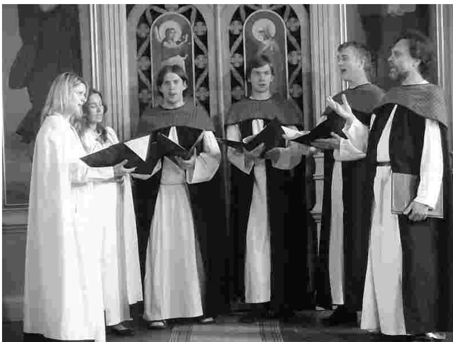
Vaimuliku muusika ansambel Heinavanker laulis tänavusel festivalil Velise õigeusu kirikus