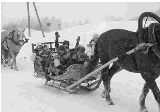
Uhke vastlasõit oli kõigile eriti meeldejääv sündmus